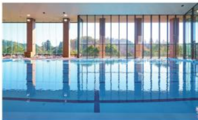
室内プール (MTC 内)

スイスにあるレマン湖をかたどった、全長130mの宿泊者限定屋外リゾートプールです。(夏季のみ営業)