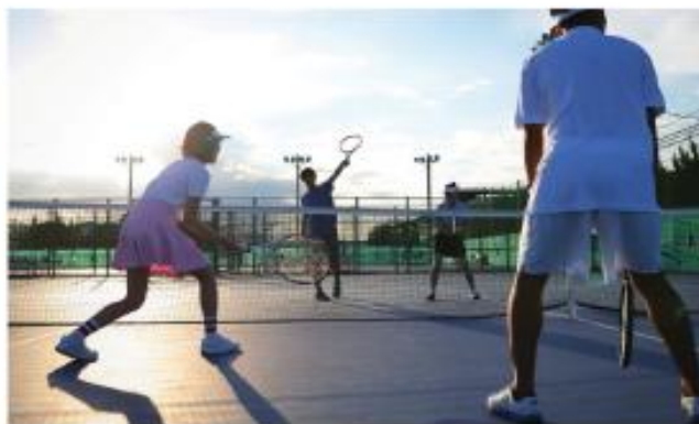
テニスコート (MTC 内)

基礎体力づくり、筋力アップなど目的に合わせてトレーニングできる多彩なマシンを揃えています。