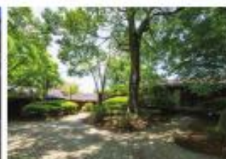
④ グラングオーコミュニケーション ヴィレージ