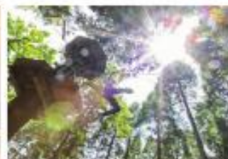
⑧ フォレストアドベンチャー・ターザニア