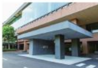
⑤ メディカルトレーニングセンター(MTC)