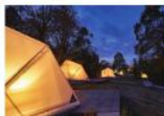
③ グラングオー スパ ヴィレージ