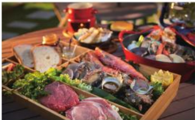
プライベートディナー

テラスハウスやログコテージにご宿泊のお客様は、お部屋のプライベート空間でディナーが可能。地産地消にこだわったBBQやお鍋のメニューをご堪能ください。