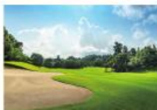
① 真名カントリークラブ

総面積100万坪、雄大な房総の森に多彩なファシリティを備える「リゾートの森」。 ゴルフも、温泉も、グルメも、遊びも。国内最大級のスポーツ施設だから実現できる、自由自在な旅がここにあります。