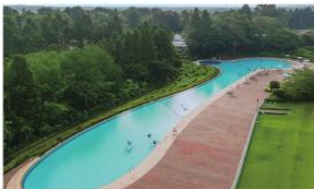
ラク・レマンプール

スイスにあるレマン湖をかたどった、全長130mの宿泊者限定屋外リゾートプールです。(夏季のみ営業)