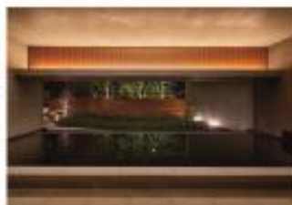
⑦ 天然温泉「紅葉乃湯」