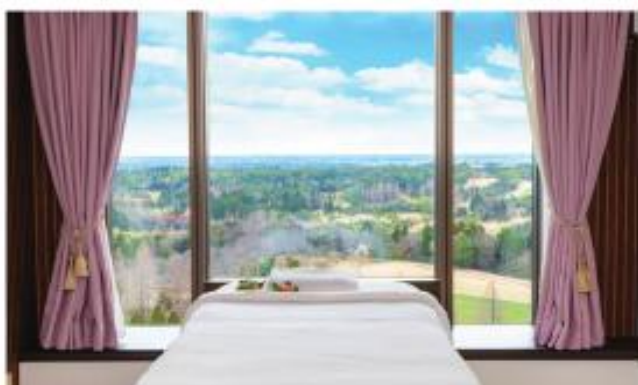
スパ ジュール・フェリエ

ホテル最上階にある森を見下ろす天空のサロン。オーガニックエッセンシャルオイルを使用したアロマセラピーで癒しのひとときをお過ごしいただけます。