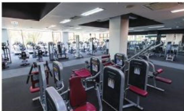
フィットネスルーム (MTC内)

25m、6コースからなる温水プール。高い天井から降りそそぐ太陽の光が開放感を演出。床暖房設備も完備しているので真冬でも快適です。