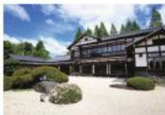
⑥ 和食処 翠州亭