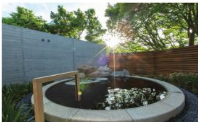
天然温泉「紅葉乃湯」

宿泊するお客様だけの天然温泉。地下600mからふんだんに湧出する黒褐色のナトリウム炭酸水素塩鉱泉。女性にうれしい美肌効果があることから「美肌の湯」とも称されます。